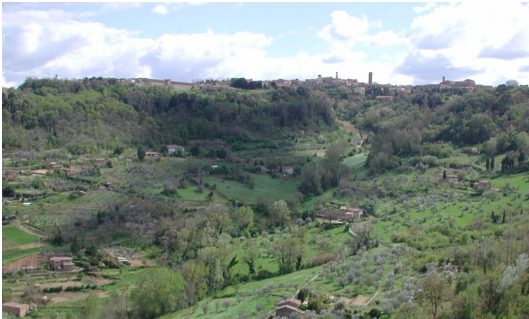
Le policolture agricole tradizionali creano paesaggi ricchi anche di biodiversità.

I processi in corso nei sistemi più tradizionali ha determinato una grande perdita di biodiversità intraspecifica. Diverse ragioni vi hanno concorso. Un ruolo preminente ha certamente avuto la scomparsa dell'agricoltura promiscua che caratterizzava le aree della mezzadria storica, il diminuito ruolo dell'ortofrutticoltura mediterranea nei territori periurbani, il declino della frutticoltura di montagna e dell'arboricoltura asciutta meridionale ... (e) quelle del mercato, guidato dalle necessità della grande distribuzione che richiede una ridotta variabilità anche in termini qualitativi. L'erosione genetica ha in ogni caso riguardato soprattutto le aree di pianura - inizialmente nelle regioni settentrionali- dove i processi di intensificazione colturale hanno visto più facilmente e rapidamente la diffusione di impianti monovarietali, la scomparsa dei frutteti promiscui a carattere familiare, la rarefazione di alberate, siepi, fasce dove si trovavano spesso specie fruttifere cosiddette minori (gelso, sorbo, azzeruolo, ecc.) solitamente non coltivate su superfici specializzate. Questa biodiversità intraspecifica rimane comunque ancora elevata se si considera che un recente censimento delle risorse genetiche frutticole italiane elenca e brevemente descrive 3.065 varietà conservate presso diverse istituzioni, e ha riguardato soprattutto le specie a ciclo breve come il pesco e meno, per ovvie ragioni legate alla durata del ciclo vitale, specie come l'olivo.